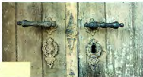
Dveře před opravou

Lukovský kostel – architektonická dominanta naší obce – získal v r. nový nátěr střechy na věži, která tím hodně „prokoukla“. Letos budou opraveny a natřeny hlavní vchodové dveře a to částečně z prostředků dotace, z prostředků Římskokatolické církve - Děkanství Lanškroun a z výtěžku vstupného z letního koncertu – poděkování všem, kteří přispěli!