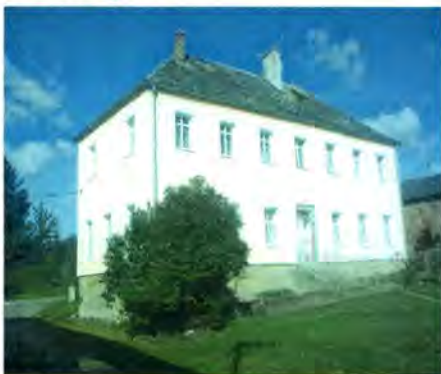
Dům Květná čp. 39 „v novém kabátě“

V Květné budou brzy opraveny všechny 4 byty. Budova dostala novou a zároveň zateplenou fasádu (z dotace „Zelená úsporám“), jsou vyměněna všechna stará okna za plastová a ještě zbývá opravit vchodové dveře. Dokončuje se rekonstrukce 3. bytu a podle finančních možností obce bude opravován i poslední byt, aby se zájemce o jeho obydlení mohl co nejdříve nastěhovat. Vybrané nájemné za užívání bytů pak pomůže obci se splátkami výhodného nízkoúročeného úvěru, který naší obci poskytl Státní fond rozvoje bydlení.