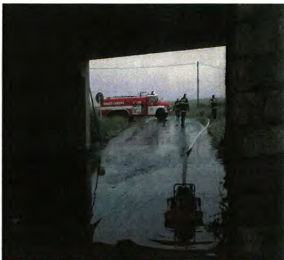
Dobrovolní hasiči z Lukové odčerpávají vodu ze zatopeného podjezdu pomocí plovoucího čerpadla po přívalovém dešti v červnu 2010