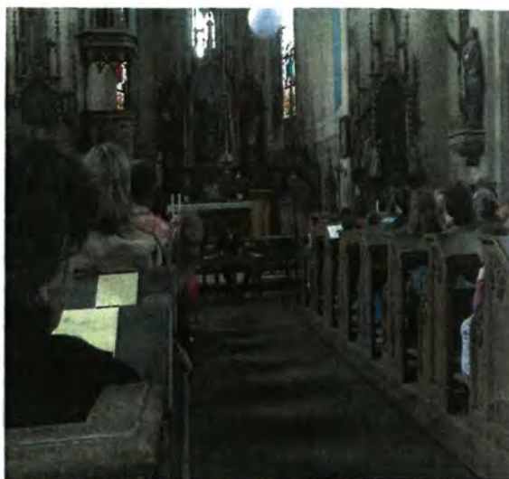
Cimbál v kostele v Lukové - letní koncert v červnu 2010