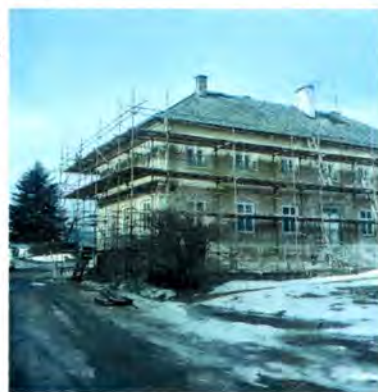
Letos v zimě ještě v lešení

V Květné budou brzy opraveny všechny 4 byty. Budova dostala novou a zároveň zateplenou fasádu (z dotace „Zelená úsporám“), jsou vyměněna všechna stará okna za plastová a ještě zbývá opravit vchodové dveře. Dokončuje se rekonstrukce 3. bytu a podle finančních možností obce bude opravován i poslední byt, aby se zájemce o jeho obydlení mohl co nejdříve nastěhovat. Vybrané nájemné za užívání bytů pak pomůže obci se splátkami výhodného nízkoúročeného úvěru, který naší obci poskytl Státní fond rozvoje bydlení.